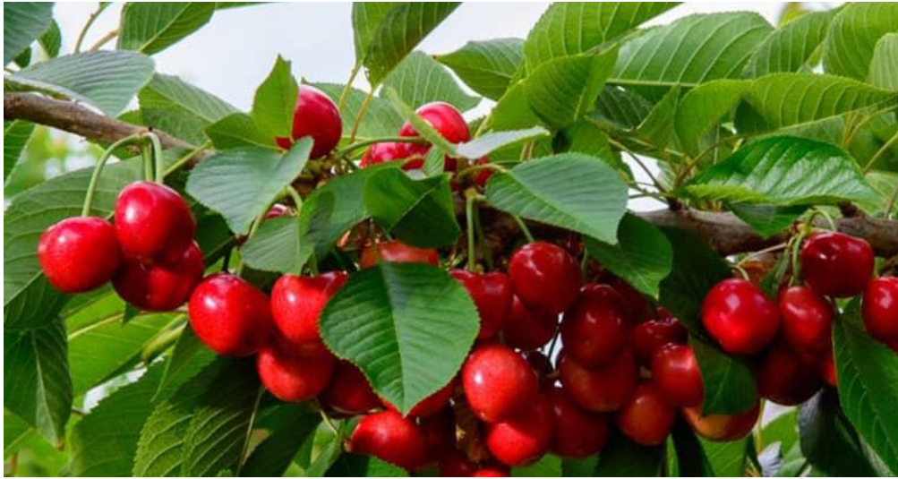
کود K60 و K60+AA موثر در بهبود کیفیت رنگ و مزه درختان میوه