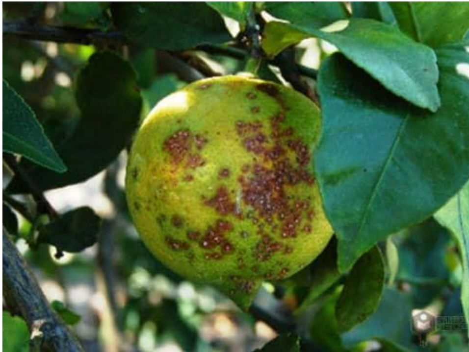
کود K60 و K60+AA موثر در کنترل و پیشگیری بیماری گموز و شانکر در مرکبات