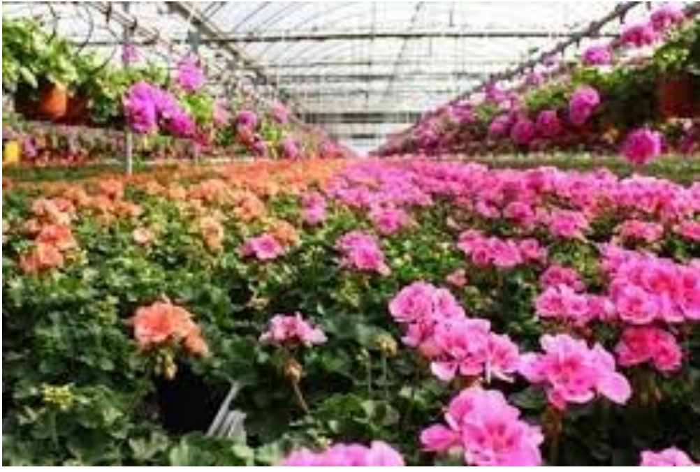
کود K60 و K60+AA موثر در بهبود کیفیت رنگ گل های شاخه بریده و گلدانی