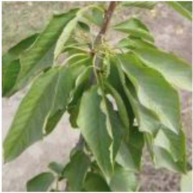
علائم کمبود پتاسیم در گیلاس